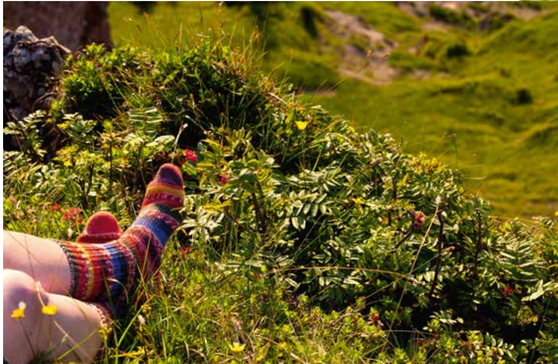
Schöne Grüße an die Füße: Die richtigen Bergstrümpfe für Groß und Klein machen das Wandern zu einem sorgenfreien Outdoor-Vergnügen.

Der Seniorchef befasst sich nun bereits seit über 60 Jahren mit der Herstellung von hochqualitativen Trekkingsocken und Trachtenstrümpfen im Handstricklook. Das Team fertigt die Produkte mit einem besonders hohen Merinowollanteil, um somit einen hohen Tragekomfort und besondere Langlebigkeit der Produkte ge-